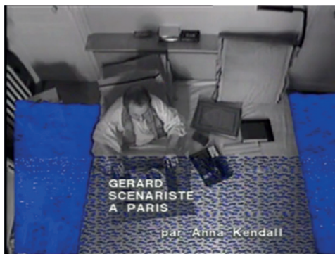
Collection Travailler à domicile